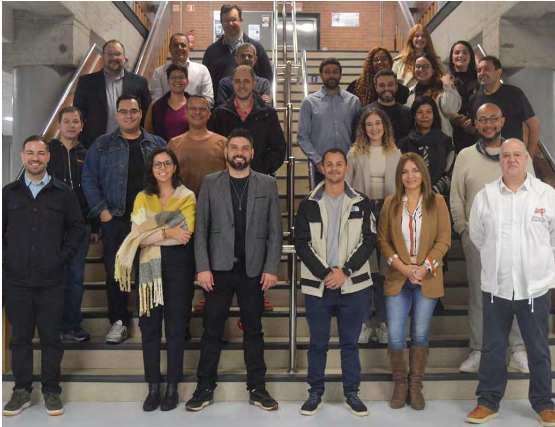
Curso avanzado de Posgrado para personal directivo de Brasil. Observatorio de Gobernanza G3 DXP – Universidade de São Paulo.